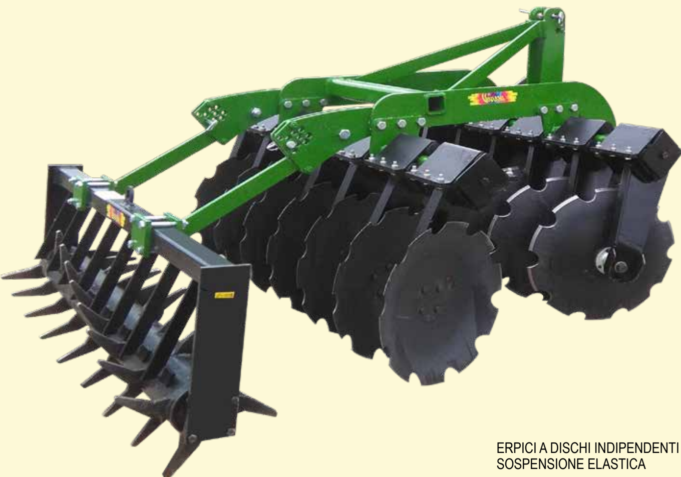
ERPICI A DISCHI INDIPENDENTI SOSPENSIONE ELASTICA