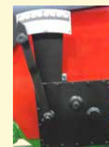
Variatore di velocità.