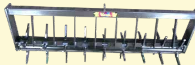
RULLO A SPUNTONI PER EFLEX e RCV