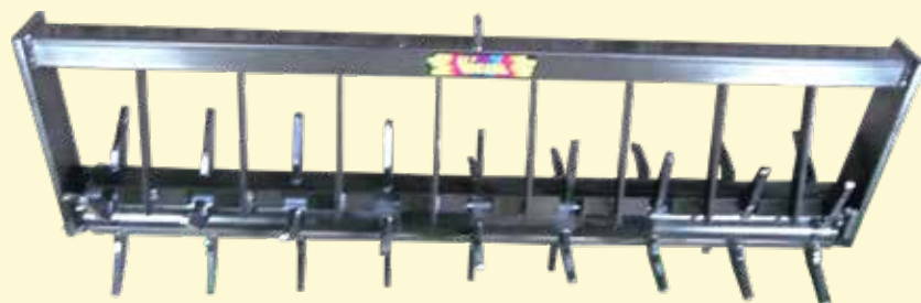
RULLO PER CI